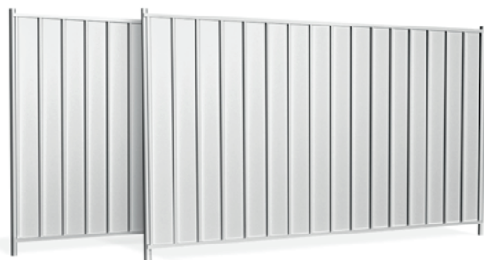
Standard - ocynk - bez malowania

Przęsła pełne z ocynkowanej blachy trapezowej