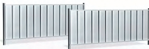
Przęsło pełne niskie